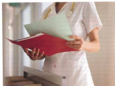
Le modèle de gestion des maladies chroniques exige un changement de paradigme, donc une gestion du changement dans les organisations, tant sur le plan des pratiques cliniques que des pratiques de gestion.

Le 20 avril dernier avait lieu, à Montréal, le colloque « Le rendez-vous de la gestion des maladies chroniques: une vision mise en action ». Un programme 1 des plus intéressants y a attiré 230 personnes, dont une majorité d'infirmières, de cliniciens et de gestionnaires.